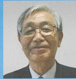
東京農工大学 同窓会長