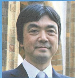
東京農工大学 学長

皆様におかれましては、本基金の趣旨をご理解いただき、是非、基金へのご協力を賜りたく宜しくごお願い申し上げます。